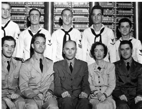
Grace Hopper Howard Aikennel és a MARK-I számítógép csapatával (1944).

Hopper 1943-ban távolléti engedélyt kapott a Vassar Főiskolától és belépett az Amerikai Egyesült Államok Haditengerészetének tartalékosai közé. Sok nőhöz hasonlóan önkéntesként szolgált a WAVES („Women Accepted for Volunteer Emergency Service” - hivatalos nevén: U.S. Naval Reserve (Women's Reserve) kötelelkezésében. A sorozáson különleges engedéllyel ment át, mert a súlya 6,8 kg-mal kevesebb volt a Haditengerészetnél előírt 54 kg (120 font) minimális testsúlynál. Kiképzése 1943-ban kezdődött meg a Flottatartalék Kadétiskolájában (Naval Reserve Midshipmen's School) a Smith College-ban, a Massachusetts Államban levő Northamptonban. Hopper az osztályból elsőként végzett 1944-ben és a Bureau of Ships Computation Project-hez került a Harvard Egyetemre, mint alhadnagy. A Howard H. Aiken irányításával dolgozó, a Mark I számítógépet programozó csoportba került